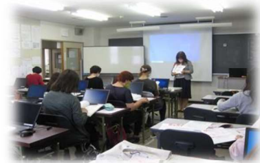
昨年の講習会の様子